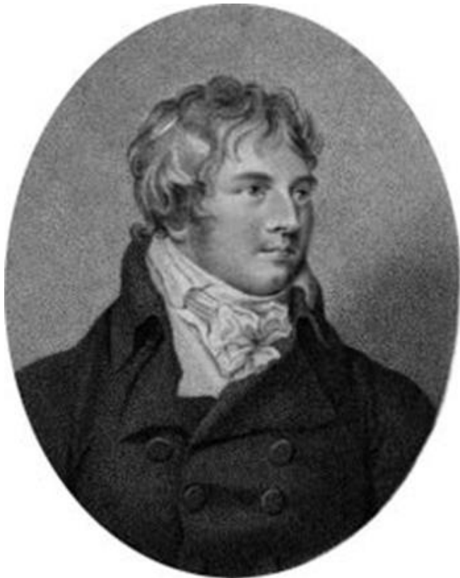
Jan Ladislav DUSSEK en 1800