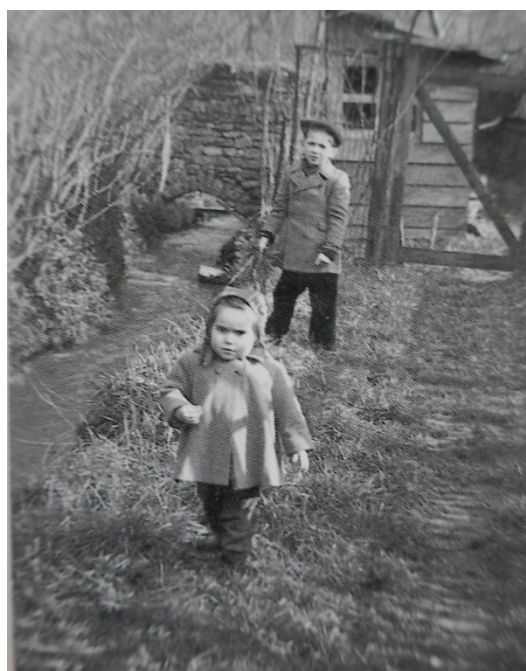
Jardins ouvriers rue Saint-Léger et le long du rû de Buzot