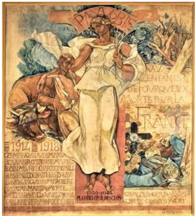
Monument aux morts par Henri Marret (1920) placé dans la mairie de Fourqueux en 1937

Élu à la Société Nationale des Beaux-Arts en 1948, il en sera le président jusqu'en 1960. Toute sa vie, il a peint avec beaucoup de sensibilité des huiles, des aquarelles de paysages d'Île-de-France, de Bretagne, d'Espagne... Souvent, le même site est repris mais il veut peindre la lumière, les reflets, les nuages, les couleurs qui changent avec le temps et les saisons. Il enseigne à partir de 1924, et pendant 20 ans, la peinture murale et la décoration à l'École nationale des Arts Appliqués.