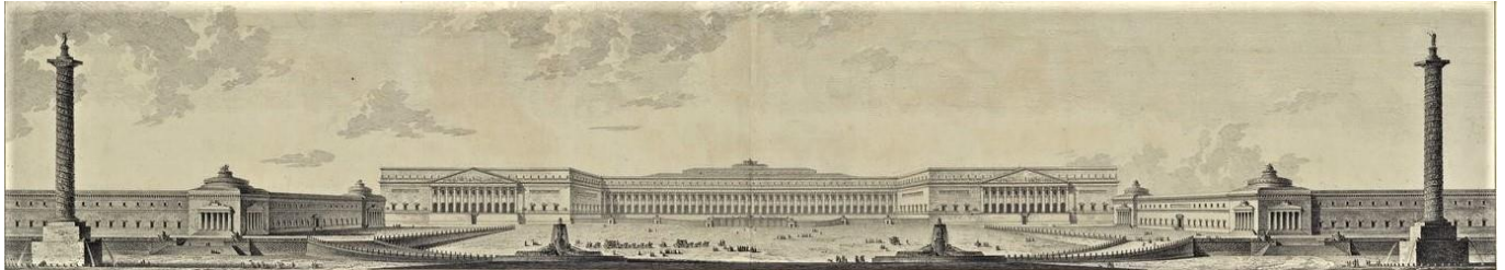
E-L Boullée : « Projet pour la restauration du château de Versailles ordonné par M. le comte d'Angiviller », (1780), BnF

En 1780, Etienne-Louis Boullée avait participé à une consultation réunissant six des architectes 3 les plus en vue pour la restauration du château de Versailles dans le but de poursuivre les travaux entrepris par Gabriel mais interrompus à la mort de Louis XV. Dans ce projet, on voit qu'il supprime « la cour de marbre » sur laquelle donnent les appartements du Roi ainsi que les toitures « à la Mansart », remplaçant « l'écrin » central par une grande façade uniforme de même proportion que les ailes qui l'encadrent.