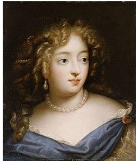
Madame de Montespan

La polémique va secouer la Cour le temps du Carnaval. Les complotistes n'ont pas atteint leur objectif, Lully est toujours bien en cour, mais le scandale a été rendu public et l'opéra ne sera plus présenté à la cour royale.