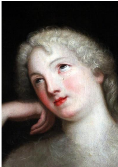
Madame de Ludres