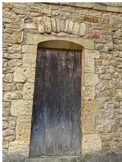
Figure 2